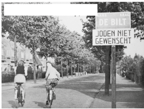
Juni 1941—door de anti-Joodse maatregelen mogen Joden niks meer en raken steeds verder geïsoleerd.