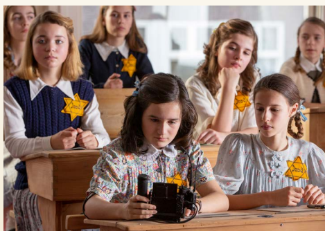
Foto van de set tijdens de opnames van het Anne Frank videodagboek.