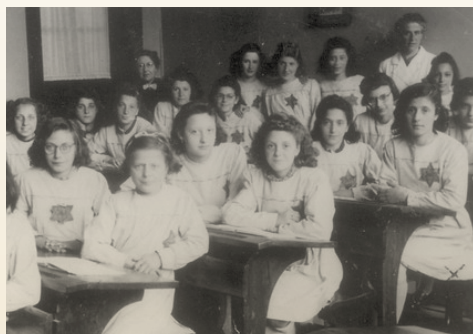
Amsterdam 1943—Een schoolklas van de Van Dethschool (huishoudschool) met Joodse meisjes met Jodensterren.