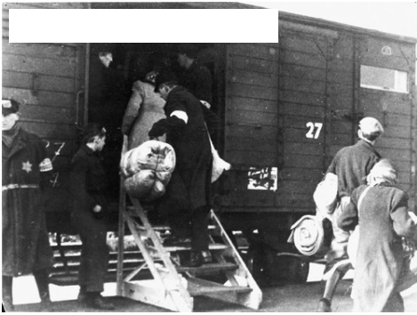
1943—Transport vanuit Westerbork. In totaal zijn er 97 transporten naar de vernietigingskampen gegaan van 15 juli 1942 t/m 13 sept 1944.