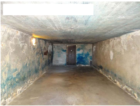
Gaskamer in vernietigingskamp Majdanek, gelegen in het door nazi-Duitsland bezette Polen.