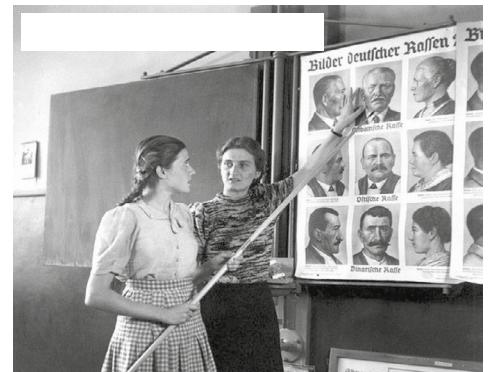
1943—Een Duitse leerling krijgt het verschil tussen Ariërs en Joden uitgelegd, deze ideologie van de superioriteit van de Duitsers legt ten grondslag aan het nationaal socialisme.