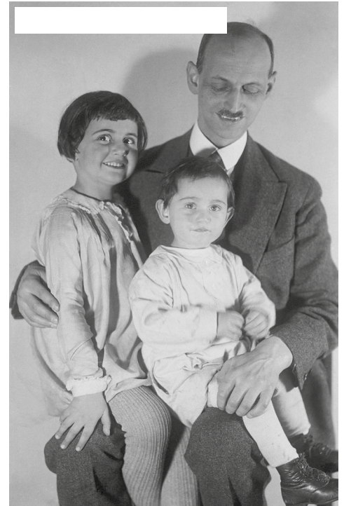
1931—Otto met zijn dochters Margot (L) en Anne (R). De familie Frank is Joods.