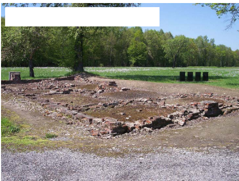
Auschwitz Birkenau, restanten van een gaskamer en crematorium. Vlak voor de bevrijding blazen de nazi's de gaskamers en crematoria op.