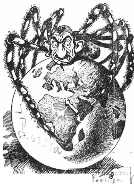
1934—Dit voorbeeld laat het vooroordeel zien hoe Joden uit zijn op macht. Ze worden vergeleken met ratten, spinnen en ander ongedierte.