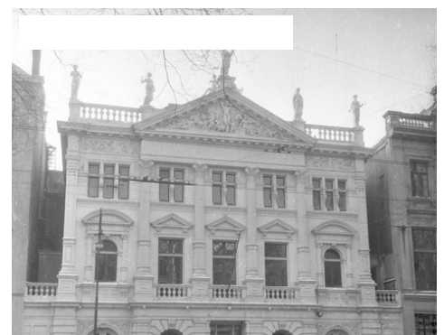
1943—Joden worden naar de Hollandsche Schouwburg gebracht voordat zij naar het doorgangskamp Westerbork worden gestuurd. Voorafgaand moesten zij al hun bezittingen inleveren en gedwongen in Joodse wijken wonen.