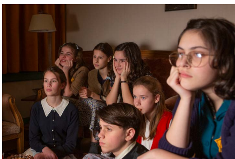
Scène uit het videodagboek.

26-10-41 Verbod op alle Joodse tijdschriften.