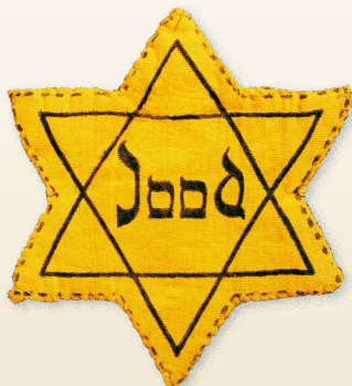
Vanaf mei 1942 moeten alle Joden in Nederland ouder dan zes jaar een jodenster dragen.