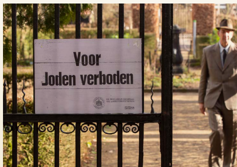
Scène uit het videodagboek. Bordje Voor Joden verboden bij de ingang van een park.