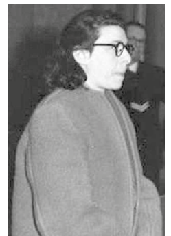
Ans van Dijk