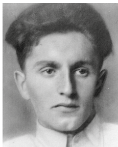
David Koker