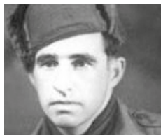
Jan Montyn Uit Naar Eer en Geweten , p. 168.