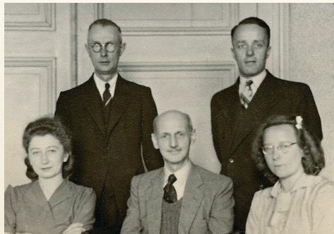
Otto met de helpers, oktober 1945. Van links naar rechts: Miep Gies, Johannes Kleiman, Otto Frank, Victor Kugler en Bep Voskuijl.