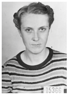
Suze Arts © Nationaal monument Kamp Vught / Beeldbank WOII.