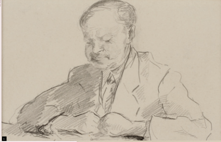
1 Portret van een onbekende man door Josef Nassy.