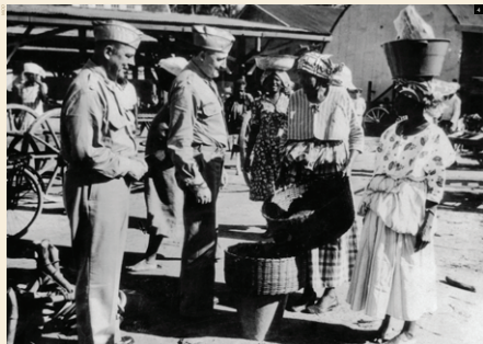
Amerikaanse soldaten op de markt in Suriname. Er was afgesproken dat de Amerikanen zoveel mogelijk lokale producten zullen gebruiken.

In Suriname arriveren - 156 militairen van de Prinses Irene Brigade uit het Verenigd Koninkrijk - 167 Koninklijk Nederlandsch Indisch Leger uit Indonesië (toen Nederlands Indië) - 1000 Amerikaanse militairen.