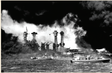
Bij de Japanse aanval op Pearl Harbor kwamen 2.402 Amerikanen om het leven en raakten er 1.282 gewond. De verliezen aan de Japanse kant waren veel kleiner: slechts 65 militairen kwamen om of raakten gewond. Een Japanse matroos werd gevangengenomen.