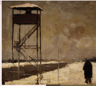
In de schaduw van de toren: De sfeer op de binnenplaats, door Josef Nassy.