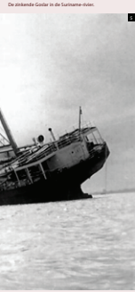
5 De zinkende Goslar in de Suriname-rivier.

Suriname-rivier te blokkeren willen de Duitsers ervoor zorgen dat de schepen met bauxiet de Paramaribo-fabriek niet meer kunnen bereiken, maar dit lukt niet. De opvarenden worden gearresteerd in opdracht van commissaris Van Beek. Het wrak is nooit geborgen en ligt als 'Van Beek-eiland' nog steeds in de rivier.