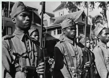
Schutters in Suriname. De Surinaamse Schutterij bestaat op haar hoogtepunt uit ongeveer 5.000 man.