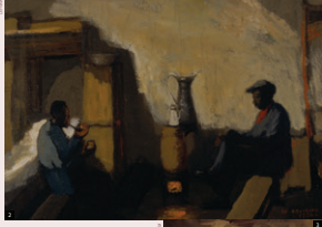
Activiteiten in het kamp: hoe de dagen worden doorgebracht, door Josef Nassy.