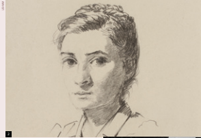
2 Portret van een onbekende vrouw door Josef Nassy.