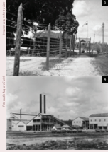
3 Dubbele hekken met prikkeldraad rondom Kamp Copieweg, het Surinaamse interneringskamp voor Duitsers en andere staatsgevaarlijke personen.

De Schutterij, maar 180 man sterk, wordt gemobiliseerd. Omdat de Surinaamse bauxiet onbereikbaar is voor de Amerikaanse vliegtuigindustrie krijgen ze al snel versterking van tweeduizend Amerikaanse troepen. In Kamp Copieweg worden 162 Duitsers geïnterneerd, waaronder de bemanning van de Goslar en nog circa honderd anderen van Duitse komaf.