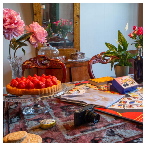
Deze twee foto's zijn van de filmset waar het videodagboek is opgenomen. Deze zijn gemeubileerd. Alles is zo goed als naar waarheid nagebouwd en ingericht.

Wil je alle kamers van het Achterhuis zien? Bekijk dan Het Achterhuis online. ► www.annefrank.org/achterhuis