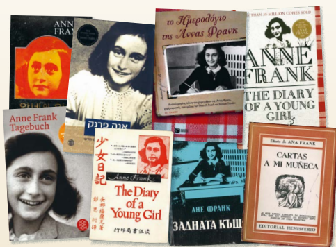
Het dagboek is in meer dan 70 talen vertaald.