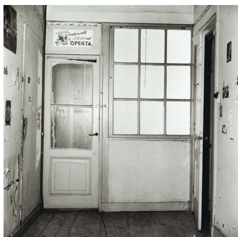
Het échte kamertje van Anne Frank in het Achterhuis. Deze is leeg. De nazi's namen na de arrestatie ook alle meubels en spullen mee.

Bekijk deze foto's en beantwoord de volgende vragen