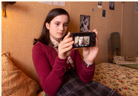
Luna als een vaak trieste Anne, tijdens de onderduik. Er bestaan in het echt geen foto's van Anne tijdens de onderduik.