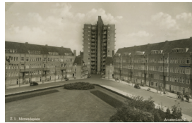
1934 – Verhuizen naar het Merwededeplein in Amsterdam