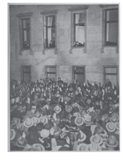
1933 – Hitler aan de macht