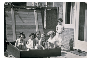
1937 – Met vriendinnen in de zandbak