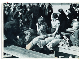
1944 – Naar Westerbork