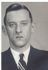
1944 – De arrestatie