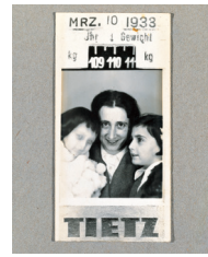
1933 – Pasfoto in Frankfurt