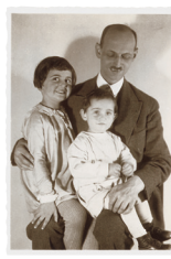
1931 – Otto Frank en zijn dochters