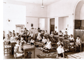
1935 – Montessorischool