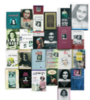
Nu - Het dagboek en het museum zijn wereldberoemd