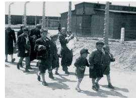
1945 – Overlijden Anne en de andere onderduikers