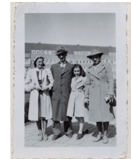
1941 – Het leven gaat door