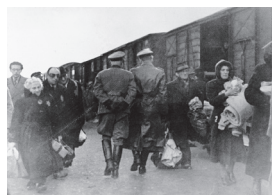
1944-1945 – Deportatie naar Auschwitz-Birkenau