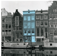
1942 – Onderduiken in het Achterhuis