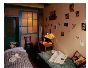
1943 – Schrijven in het dagboek tijdens het onderduiken