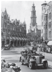
1940 – Duitse invasie Nederland