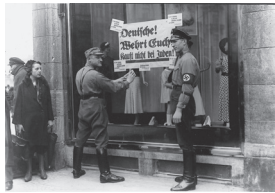
1933 – Boycot Joodse winkels, dokters en advocaten