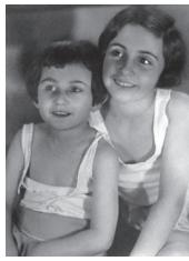
1933 – Logeren bij oma in Aken