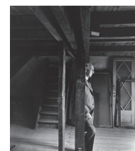
1960 – De schuilplaats wordt een museum