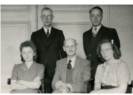
1945 – Otto Frank en de helpers