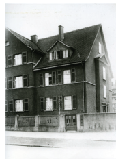
1929 – Geboorte Anne Frank