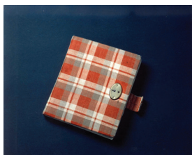
1942 – Het dagboek