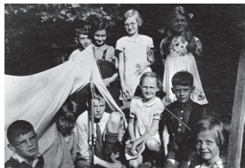
1937 – Zomerkamp Laren