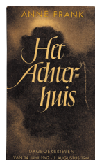
1947 – Het dagboek wordt uitgegeven