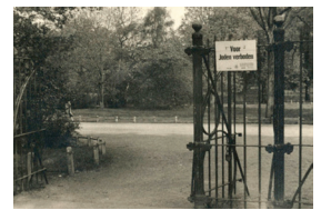
1941 – Anti-Joodse maatregelen