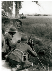
1939 – Duitsland valt Polen binnen