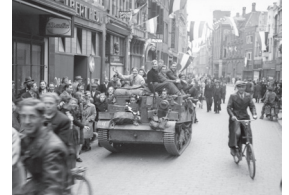
1945 – Bevrijding Nederland