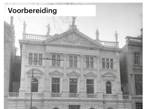
Vorbereiding 1943—Joden worden naar de Hollandsche schouwburg gebracht voordat zij naar het doorgangskamp Westerbork worden gestuurd. Voorafgaand moesten zij al hun bezittingen inleveren en gedwongen in Joodse wijken wonen.