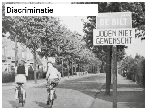
Discriminatie Juni 1941—door de anti-Joodse maatregelen mogen Joden niks meer en raken steeds verder geïsoleerd.