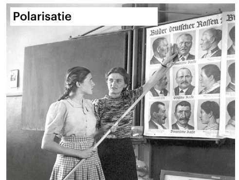
Polarisatie 1943—Een Duitse leerling krijgt het verschil tussen Ariërs en Joden uitgelegd, deze ideologie van de superioriteit van de Duitsers legt ten grondslag aan het nationaal socialisme.