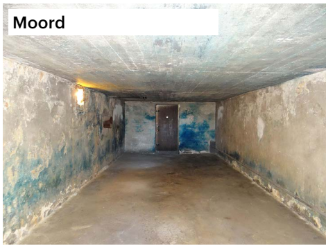
Moord Gaskamer in vernietigingskamp Majdanek, gelegen in door de Duitsers bezette Polen.