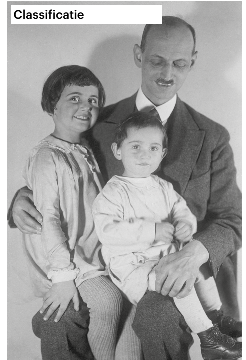
Classificatie 1931—Otto met zijn dochters Margot (L) en Anne (R). De familie Frank is Joods.