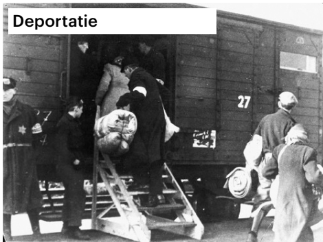
Deportatie 1943—Transport vanuit Westerbork. In totaal zijn er 97 transporten naar de vernietigingskampen gegaan van 15 juli 1942 t/m 13 sept 1944.