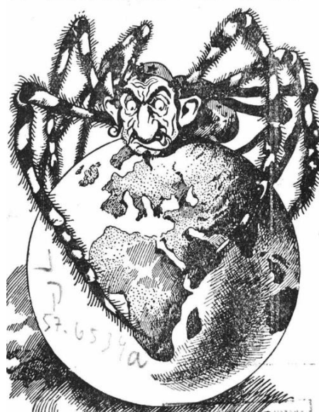
Ontmenselijking 1934—Dit voorbeeld laat het vooroordeel zien hoe Joden uit zijn op macht. Ze worden vergeleken met ratten, spinnen en ander ongedierte.