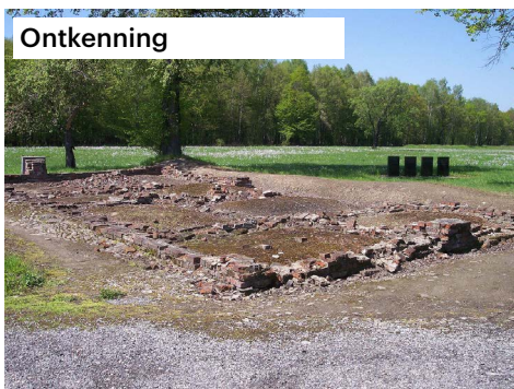
Ontkenning Auschwitz Birkenau, restanten van een gaskamer en crematorium. Vlak voor de bevrijding blazen de nazi's de gaskamers en crematoria op.